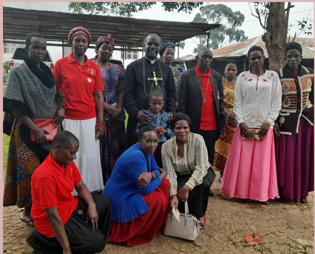
Mlezi wa Utume wa Damu Taifa katika picha ya pamoja na wanautume wa Damu Itahwa.

wakati Ibada kwa Damu Azizi ilipoenea katika Jimbo la Campagna Italia. Leo nahisi anasema: “Moyo wangu unafurahi kupindukia kuona Jimbo la Bukoba likizama ndani ya bahari ya huruma ya Mungu ambayo ndiyo Damu Azizi ya Mwanakondoo” (Mt. Gaspari barua n. 3806).